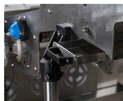
Bandejas de cortesía

La FH600 es un equipo para el formado de lámina de masa de manera continua, partiendo de grumo, recorte o mezcla de ambos. Es un equipo de gran producción 2500/3000 Kg/Hs, para utilizar solo, o en una línea productiva.