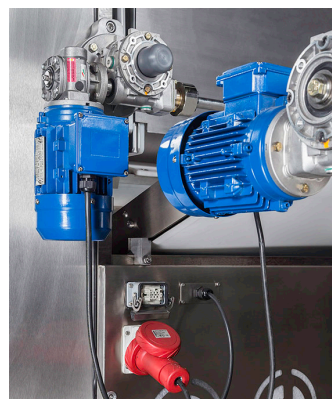
Fichas de conexión segura