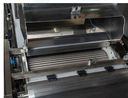
Apertura de tolva Sistema HiSTec